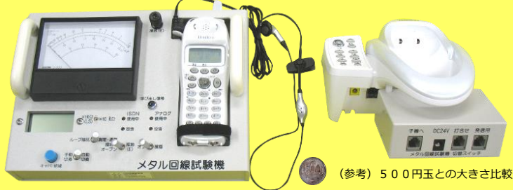
通話回線切替スイッチ